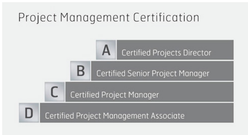
Fig. 3 - I quattro livelli di Certificazione riconosciuti a livello internazionale: i livelli da D ad A sono rappresentativi progressivamente di una più elevata esperienza

elementi nei processi di Certificazione internazionale dei Project, Programme e Portfolio Manager. È proprio accennando alla Certificazione IPMA che chiudo queste riflessioni sull'IPMA ICB.