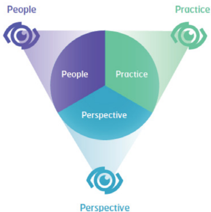
Fig. 2 - L'occhio delle Competenze, immagine utilizzata dall'ICB per rappresentare l'universo delle competenze di project management; è strutturato in tre Aree di competenza: Perspective, People e Practice